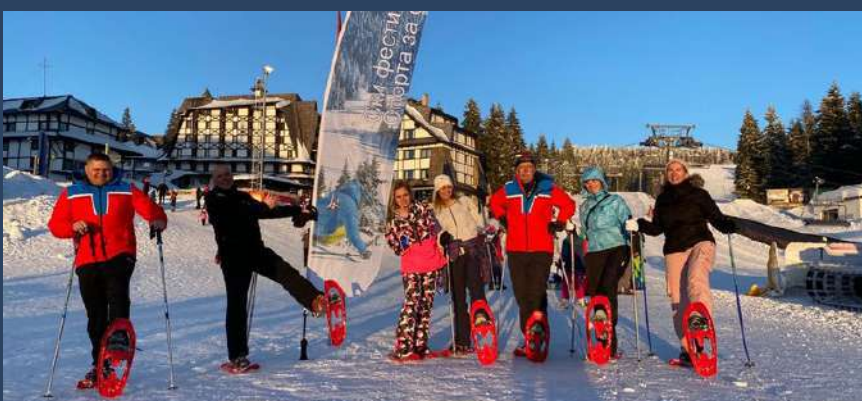
ŠETNJA SA KRPLJAMA